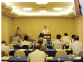
▲建設業部会通常総会の様子