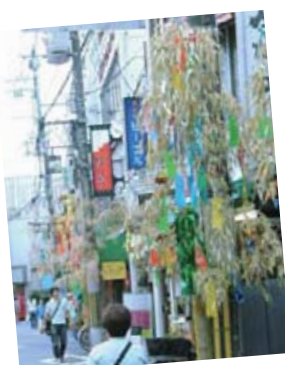
▲七夕かざりの模様