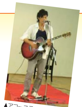
▲アコースティックライブ