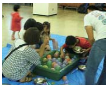
▲上手にできるかな…?